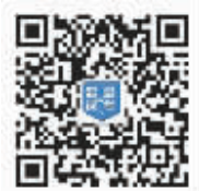
超级云课堂 微信二维码