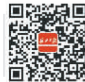
扫描长江日报官方微信二维码即可参加“最美全家福”活动

他称赞,由长江日报主办的武汉“最美全家福”公益评选活动,传递着温情、温暖和幸福,彰显出市民的幸福感、获得感、成就感。许多精彩的照片很温情、很温馨,让人感到一个冬天都是暖暖的。在一个充满幸福感的群体里,人们会自觉或不自觉受到感染,感受到生活中共同的美好和幸福”。